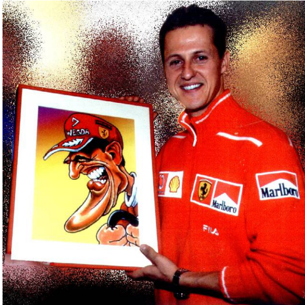
Formel I-WeltMeister Michael Schumacher

SCHNELLZEICHNUNGEN KARIKATUREN ILLUSTRATIONEN